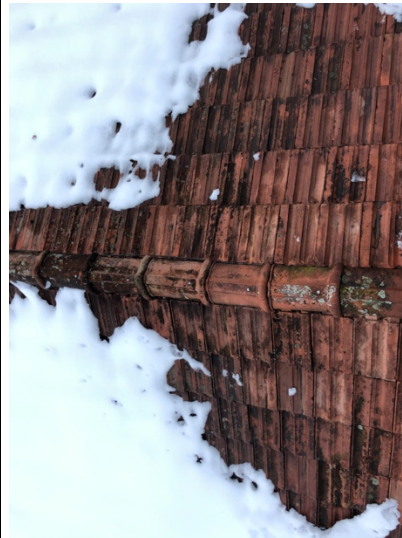
Ziegeldach im Firstbereich