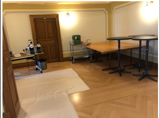
Möbellager im OG (pot. Erweiterungsfläche / Bürofläche)