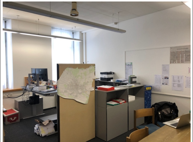
Büro / Pausenraum mit Teeküche