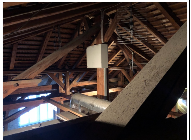
Dachstuhl in sehr gutem Zustand.