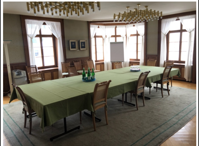
Parlamentssaal (2 geschossig)