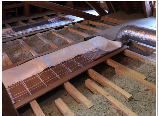
Dämmung oberste Geschossdecke teilweise nicht existent.