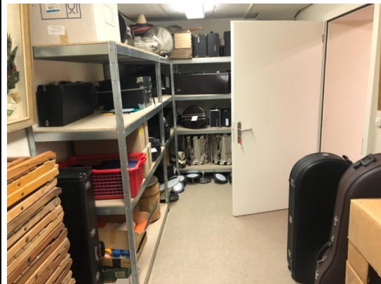
Instrumentenlager Stadtmusik Weinfelden in den alten Tresorräumen